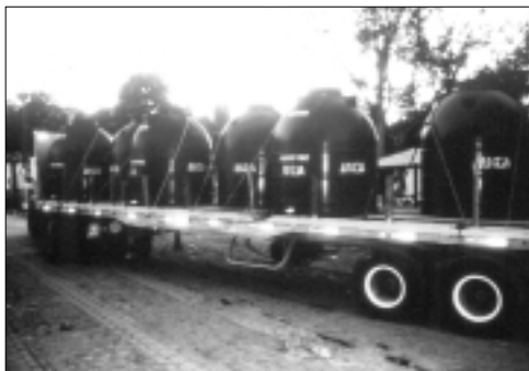
Adecuación de camión para distribución de agua debido a falta de disponibilidad de camiones cisterna durante los terremotos de El Salvador.