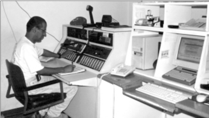
Centro de Operaciones de Emergencia (C.N.E./C.R.)

Dependiendo de las condiciones de servicio que brinda la empresa, esta sala de situación toma carácter nacional y podrá contar con otras salas de situación para cada una de las regiones o sistemas en que se divide la empresa, por lo que lo expresado en este apartado deberá ser aplicable en cada una de esas salas de situación.