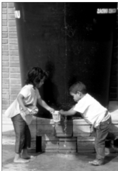
Agua segura en albergues, Huracán Mitch, Honduras, 1998 C. Osorio, 1998

A manera de ejemplo, en la tabla 4 se presentan las alertas ante amenazas hidrometeorológicas, utilizadas por la Comisión Nacional de Prevención del Riesgo y Atención de Emergencias (CNE) de Costa Rica.