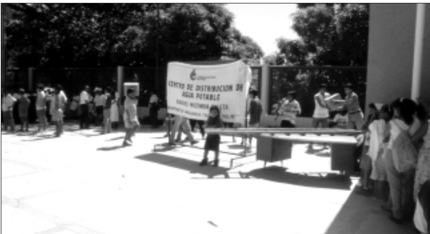
Distribución de agua potable en caso de emergencia. Huracán Pauline, México, 1997

Por lo general, todas las empresas de servicios de agua potable y alcantarillado disponen de un esquema para la atención de las averías en tuberías y canales, daños generales sobre la infraestructura, falta de energía eléctrica, variaciones en la calidad y cantidad de los suministros de agua, etc. Este Plan puede calificarse como el primer nivel de intervención de la organización para emergencias, que lo convierte en la base fundamental para el desarrollo de acciones para la atención de desastres o emergencias mayores.