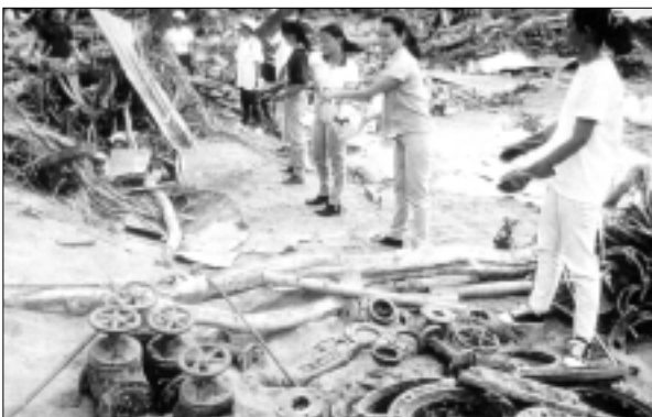
Afectación a bodegas de la empresa de agua Tegucigalpa, Honduras, a raíz del huracán Mitch.

Es recomendable que dentro del plan operativo de emergencia, se incorporen las medidas a tomar durante situaciones de desastres para que se garantice que, en caso de presentarse una emergencia en horas no hábiles, pueda disponerse de los recursos de los almacenes y otras dependencias, a pesar de que las personas que habitualmente hacen su labor en éstos no estuvieran disponibles.