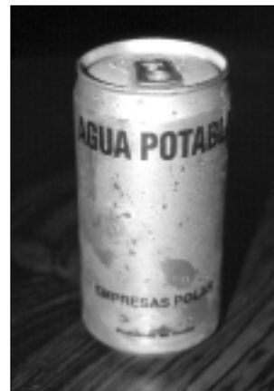
Coordinación y apoyo de la empresa privada, para la distribución de agua, Venezuela, 1999

Cada región tiene características propias, por lo que es conveniente que se pueda analizar la idiosincrasia del lugar e incorporar, en el proceso de desarrollo de los planes de emergencia, a las fuerzas vivas locales y, al igual que se realizan convenios previos con la empresa privada, se alcancen compromisos con estos grupos comunales. Dentro de esta negociación, la comunidad debe ser capacitada y adiestrada, para lo cual la misma organización comunal puede contribuir en estas tareas.