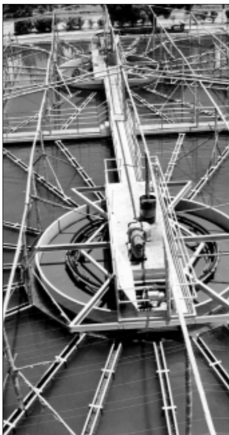
Medida de emergencia instalación de estructura para evitar caída de cenizas, protegiendo planta de tratamiento. Erupción Volcán Pichincha, Ecuador, 1999

Su principal responsabilidad radica en la formulación, evaluación, control y seguimiento del programa de prevención y atención de emergencias y desastres. Para cumplirla deberá impulsar los análisis de vulnerabilidad de los componentes de los sistemas, dar seguimiento al programa y a la formulación de los planes operativos, así como llevar a cabo su evaluación periódica con el fin de garantizar que se encuentren actualizados. Para este trabajo se requiere una directa y estrecha coordinación con los comités operativos de emergencia.