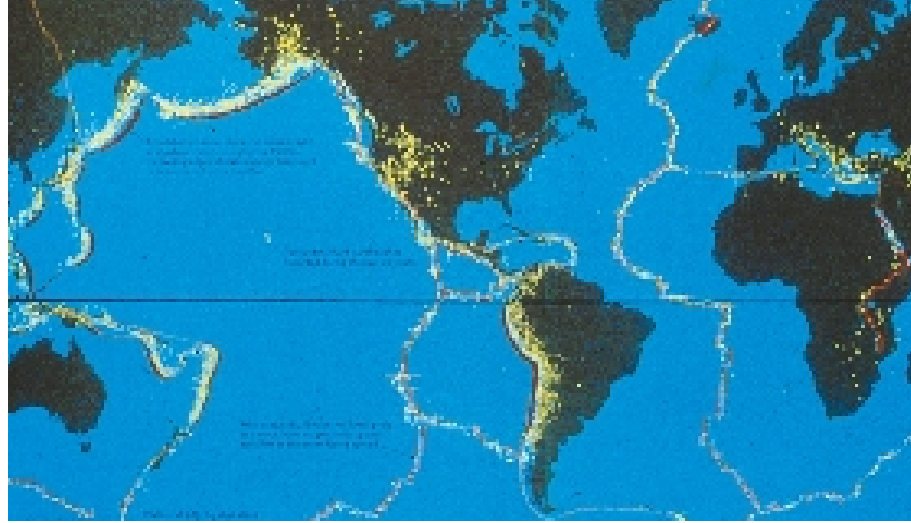
Cinturón de fuego

deformación del suelo y objetos arrojados al aire.