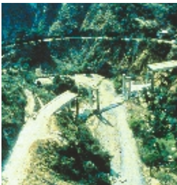
Los terremotos generalmente interrumpen los servicios de apoyo

Aunque la investigación está avanzando, no siempre es posible advertir a la población sobre un terremoto inminente; consecuentemente, este ocurre de manera súbita e inesperada. Algunos signos de un próximo terremoto pueden ser el comportamiento extraño de los animales, gases o temblores leves. Generalmente, se utiliza la escala de Richter para medir la magnitud sísmica o la energía liberada. Esta escala es abierta, pero un terremoto de magnitud dos se podría solo detectar con instrumentos muy sensibles, mientras que un terremoto de magnitud ocho ocasionaría una destrucción total de las estructuras,