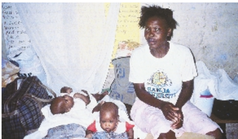
Una madre soltera con sus gemelos en un albergue después del huracán Gilbert, Jamaica

Por lo general, los asentamientos temporales son áreas con una densidad de población sumamente alta y se ubican en lugares que originalmente no estaban destinados a alojar tantas personas. Es probable que no existan servicios apropiados de salvamento y la falta de agua y de servicios higiénicos básicos pueden aumentar el riesgo de enfermedades transmisibles (principalmente las endémicas en las áreas de origen, tránsito y asentamiento). Las enfermedades transmitidas por el agua causan más de 50% de las muertes entre las personas desplazadas. La