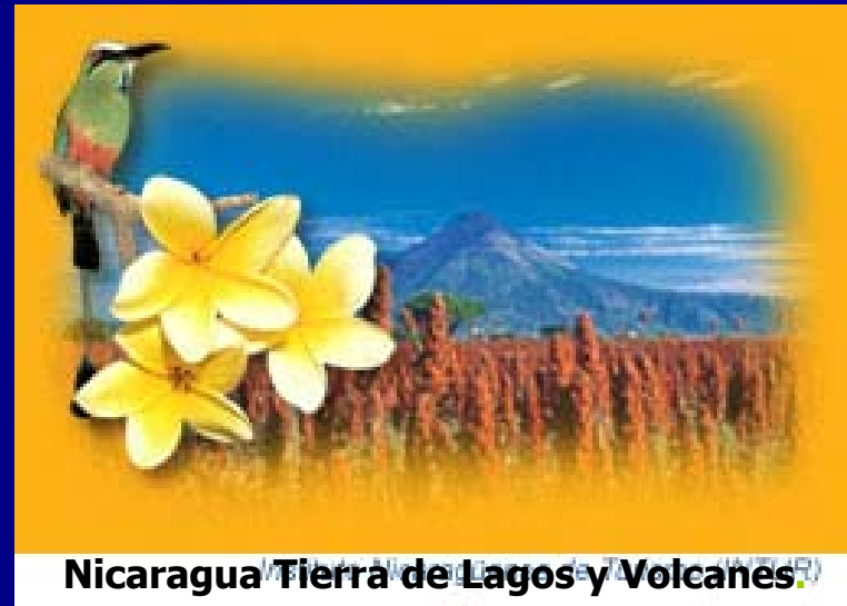
Nicaragua Tierra de Lagos y Volcanes

Consecuencias: Inicia Institucionalización del PED, Cambia el enfoque institucional, Liderazgo del Minsa, esfuerzos sectoriales, Comisión de Salud – PRISS.