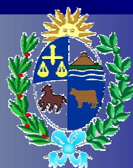
PRESIDENCIA DE LA REPUBLICA Sistema Nacional de Emergencias