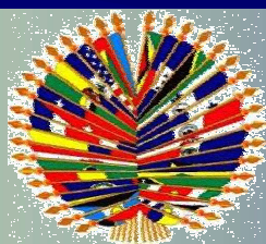
Organización de los Estados Americanos