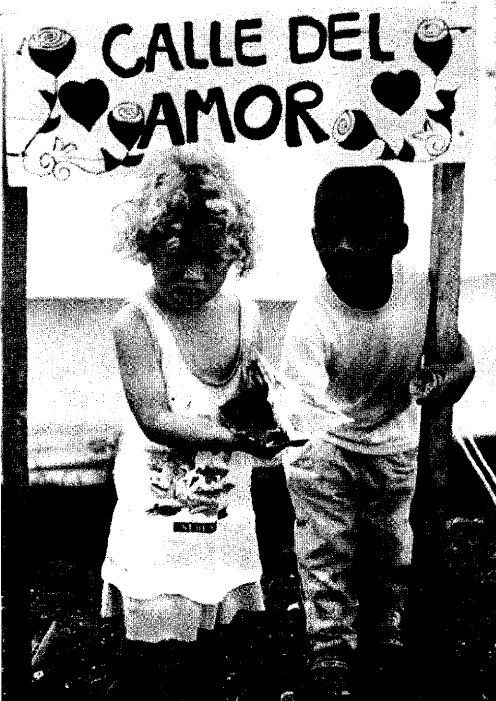
Taller de pintura y origami, Quindío, 1999