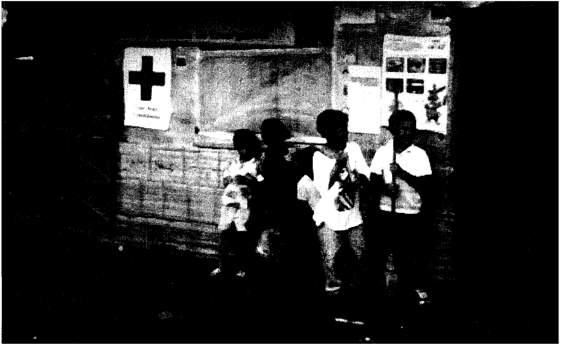
Escuela Saludable en Emergencia, Barcelona-Quindío, 1999