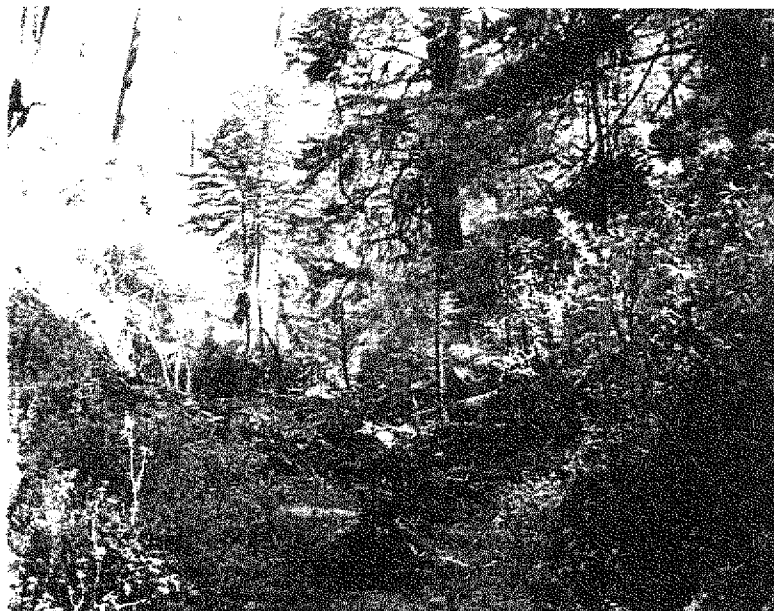
Fotografía 7. Barranca "El Aguardientero", elevación de 3,200 msnm.