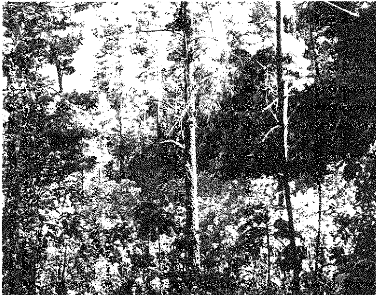
Fotografía 8. Barranca "El Aguardientero", elevación de 2,900 msnm.