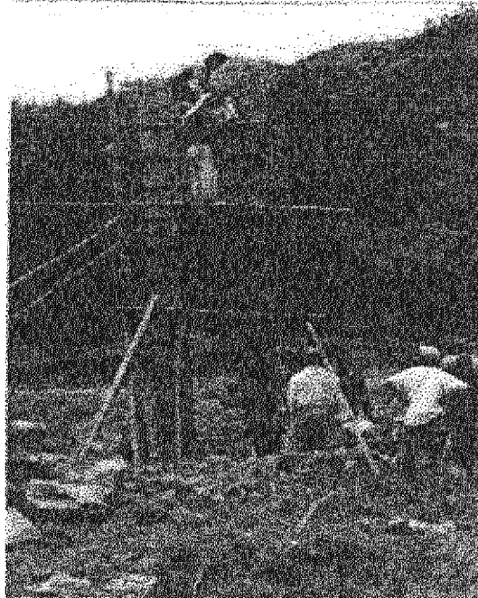
Participación de la comunidad en la construcción de paso elevado

En términos económicos, el aporte realizado por la comunidad fue de USD 3.000 en el caso de Chimborazo y USD 600 en el caso de Tungurahua.