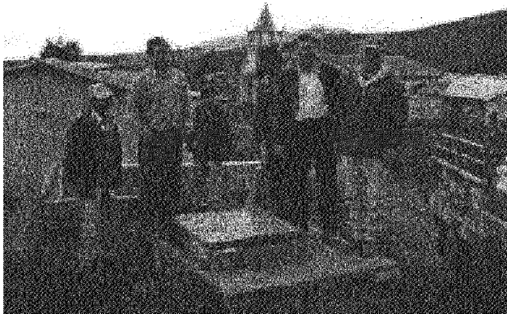
Verificación de la finalización de los trabajos realizados