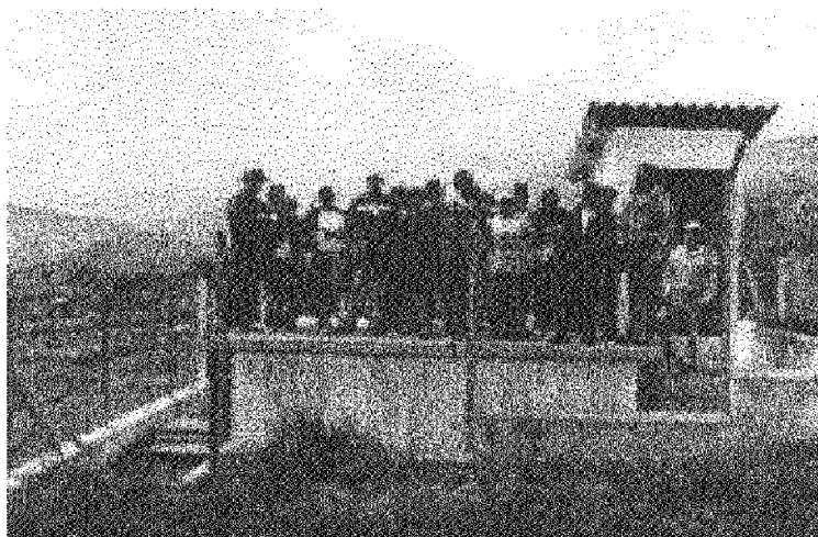
Práctica de Operación y Mantenimiento durante la capacitación

El material utilizado en esta fase se adjunta en el Anexo 1 de este documento