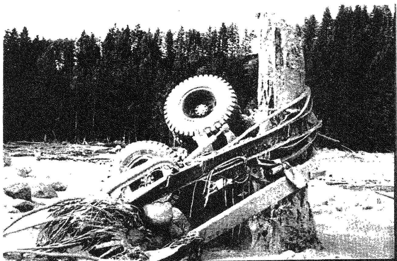
FIGURA 7. Arbol arrancado y en torno a él un camión de transporte, dando testimonio del poder destructivo de los flujos de lodo causados en 1980 por la erupción del Monte Santa Elena