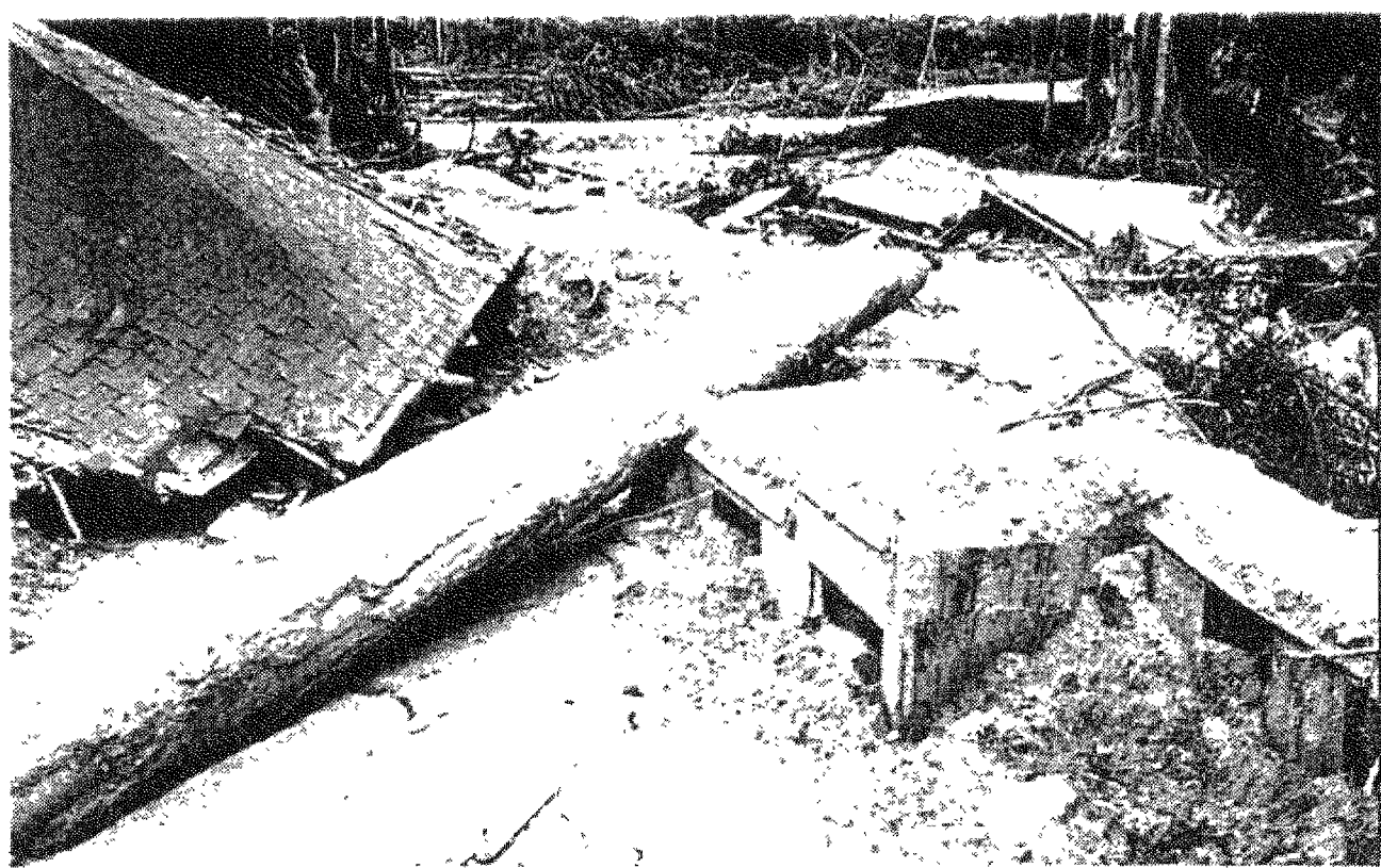
FIGURA 6. Flujos de lodo destruyeron y enterraron bosques, casas, rutas y puentes hasta 20 km y más, en los valles cercanos al Monte Santa Elena